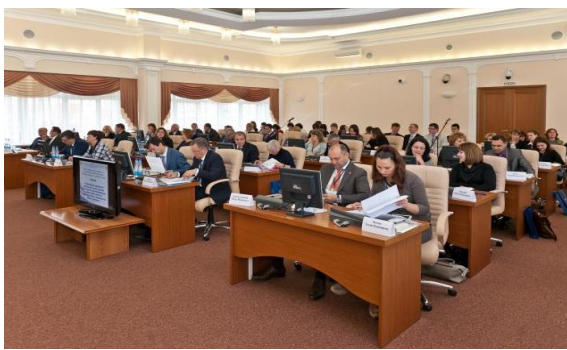
Участники семинара контрольно-счетных органов в городе Владимире, 30.09.2014