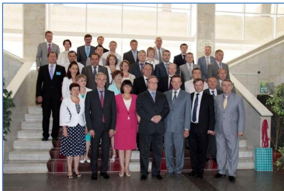
Участники Межрегиональной научно-практической конференции в городе Ульяновске, 18.06.2013