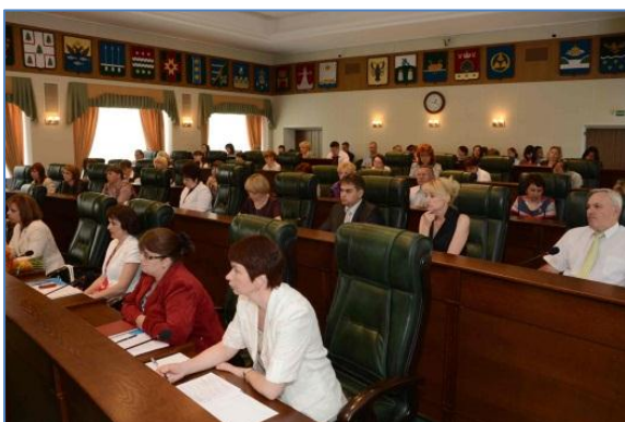
Участники Общего Собрания членов Ассоциации органов внешнего финансового контроля Тверской области, 14.05.2013

вопросах организации и деятельности контрольно-счетных органов муниципальных образований Тверской области»;