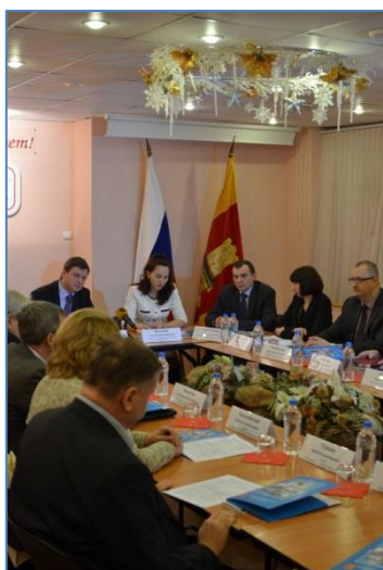
Участники расширенного заседания Коллегии КСП Тверской области, 18.12.2013

3) 18 декабря 2013 года состоялось расширенное заседание Коллегии Контрольно-счетной палаты Тверской области на тему «Итоги и перспективы взаимодействия правоохранительных, надзорных и контрольных органов при осуществлении финансового контроля в Тверской области» (далее – Расширенное заседание, Коллегия).