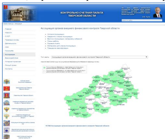
Скриншот раздела «Ассоциация» сайта КСП Тверской области

- Базе данных статистической информации по Тверской области (Территориальный орган службы государственной статистики по Тверской области, через сеть Правительства Тверской области);