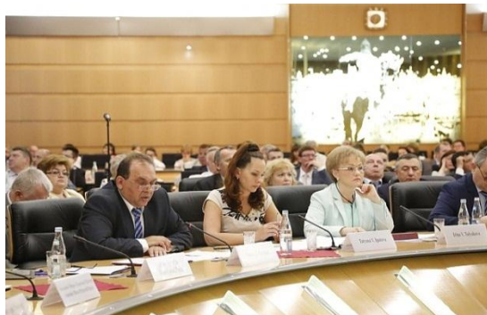
Участники международного семинара «Гласность и подотчетность контрольно-счетных органов», 23.05.2014

23 мая 2014 года в Москве состоялся международный семинар на тему «Гласность и подотчетность контрольно-счетных органов». Для участия в семинаре в столицу прибыли делегации из российских регионов и зарубежных стран.