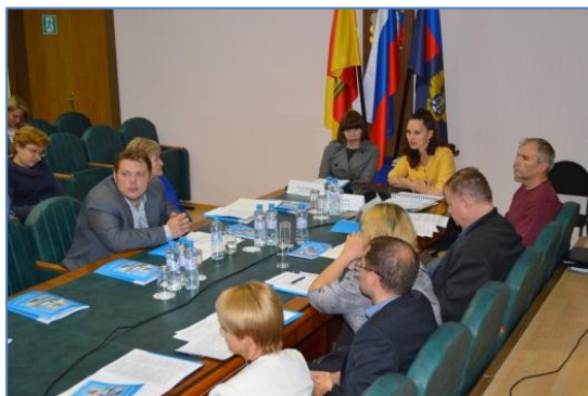
Участники видеоконференции «Перспективы совершенствования бюджетного процесса в Тверской области», 20.09.2013

2) 20 сентября 2013 года состоялось Общее Собрание членов Ассоциации органов внешнего финансового контроля Тверской области (в режиме видеоконференции) на тему «Перспективы совершенствования бюджетного процесса в Тверской области» (далее – Общее Собрание, Собрание).