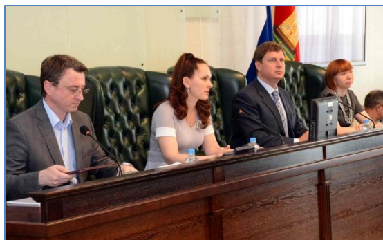
Президиум Общего Собрания членов Ассоциации органов внешнего финансового контроля Тверской области, 14.05.2013

1) Общего Собрания членов Ассоциации органов внешнего финансового контроля Тверской области на тему: «Итоги работы Ассоциации органов внешнего финансового контроля Тверской области в 2012 году. Перспективы совершенствования государственного и муниципального финансового контроля в Тверской области» (далее – Общее Собрание, Собрание) 14 мая 2013 года.