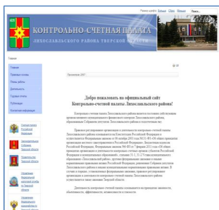
Скриншот главной страницы интернет-сайта КСП

В отчетном периоде контрольно-счетные органы муниципальных образований Тверской области проводили работу по обеспечению гласности и открытости своей деятельности. Так, по итогам 2013 и 2014 годов в средствах массовой информации (печатных, радио и телевидении, сети Интернет) было размещено 629 публикаций, отражающих деятельность контрольно-счетных органов муниципальных образований Тверской области.